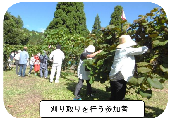
刈り取りを行う参加者

9月5・6日(土・日)農事法人「医王の恵み」は才川地内の山ブドウ畑で収穫体験会を行いました。地域内外から多くの参加者が訪れ、たわわに実った山ブドウをハサミで丁寧に刈り取りバケツに入れていました。ブドウ踏み体験コーナーでは子どもがたらいに入れられた山ブドウを踏んで潰していました。会場では山ブドウの加工品や太美山産のトマトの販売も行われ、たくさんの方が買い求めていました。今年は気候条件に恵まれたおかげで順調に育っており、山ブドウ約250本からは約600キロの収穫が見込まれるそうです。