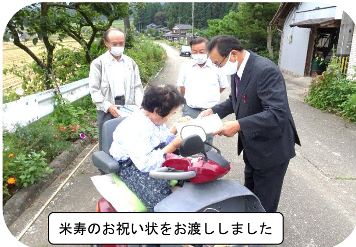
米寿のお祝い状をお渡ししました

長年にわたり地域繁栄の礎を築いていただいた功績に対する感謝とご高寿のお祝いとして、今年度は新型コロナウイルス感染症対策のため敬老会の式典を中止し、西太美地区の75歳以上の方196名の皆さんに、民生委員や各地区の福祉推進委員ら社会福祉部会のメンバーが記念品をお届けしました。また今年米寿を迎えられた9名の方には、地域づくり協議会会長、副会長が南砺市長からのお祝い状を手渡ししました。長寿を迎えられた皆さんには今後ますますのご健康とご多幸をお祈りいたします。