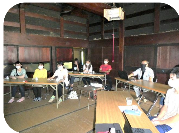
熱心に勉強会を行う学生の皆さん

小院瀬見のCasaは富山国際大学現代社会学部の学生と協力し、才川1区の築150年の古民家をワインバーに改修するプロジェクトをスタートさせました。9月5日（土）現地で検討会を開催し、学生が発表した案を基に内装デザインを決めました。バーでは、福光地域で生産されたワインや無農薬野菜を使った郷土料理を提供する予定だそうです。年内のオープンを目指しているそうです。