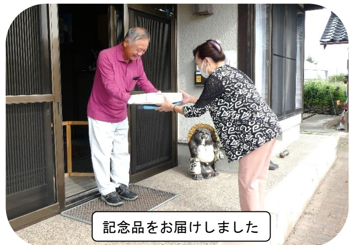
記念品をお届けしました