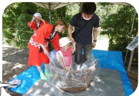
ぶどう踏みを楽しむ親子連れ