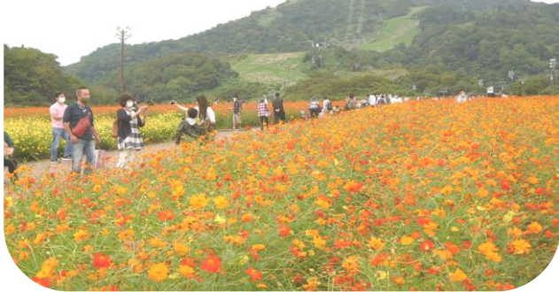
一面に広がるコスモスを楽しむ観光客