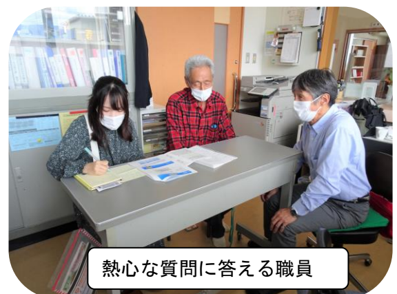
熱心な質問に答える職員