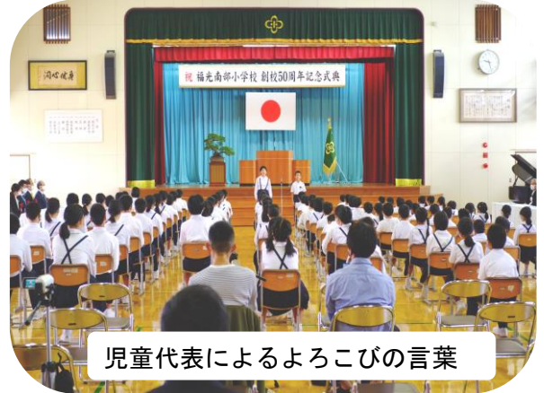
児童代表によるよろこびの言葉