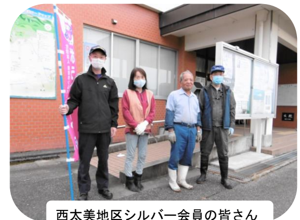
西太美地区シルバー会員の皆さん