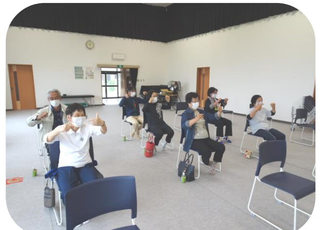
指先の運動「指がモタモタなるわー」

冬の間は寒さと運動不足で体が硬く縮こまりがちになります。貯筋運動で体の筋肉を伸ばして血行を良くし、みんなでかけ声を合わせ、楽しく行っていきたいと思います。