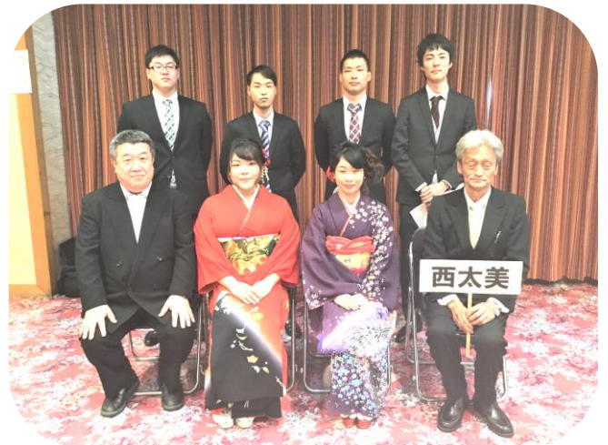
西太美地区の成人者の皆さん