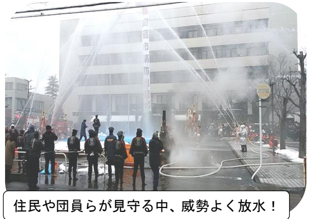
住民や団員らが見守る中、威勢よく放水！

1月6日（土）南砺市消防出初式が福光庁舎前にて行われ、市消防団、南砺消防署各署所、婦人防火クラブなどが参加し、初放水が行われました。続いて福光屋内グラウンドにて式典が行われ、多年にわたって消防活動に精励し功績のあった団員や家族への表彰や感謝状の贈呈が行われました。式典にて表彰された方は以下のとおりです。（敬称略）