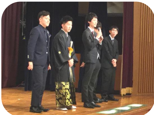
各地区代表者が近況や抱負を語る