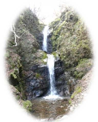
緋吊りの滝 (令和2年3月9日撮影)

緋吊りの滝は奥医王へ登る幹線道路の途中にあります。2段に分かれて落水する高さ約13m余りの滝で、秋には紅葉したヤマモミジやヌルデが水に映り美しい光景が見られます。ぜひ一度足を運んでみてはいかがでしょうか。西太美地域づくり協議会は今後も整備を続け、地区内外の方に見学していただけるようにしていきたいと思えます。