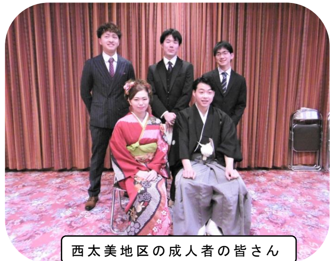
西太美地区の成人者の皆さん