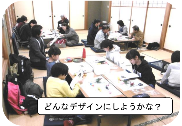
どんなデザインにしようかな?