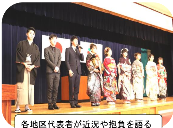
各地区代表者が近況や抱負を語る