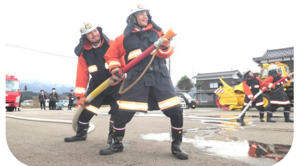
住民や団員らが見守る中、威勢よく放水！