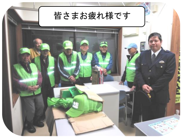
皆さまお疲れ様です