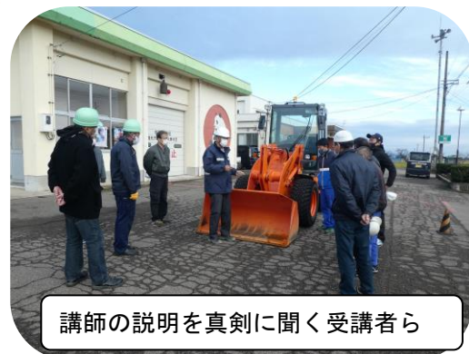
講師の説明を真剣に聞く受講者ら

11月28日（土）、29日（日）の2日間にわたり、西太美交流センターで小型ホイールローダー講習会を実施しました。才川地内から10名の受講者がありました。コマツ教習所(株)栗津センタの教官に出向いただき、1日目に学科、2日目に実技の講習を受け、「小型車両系建設機械（整地等）の運転」の特別教育終了証を全員が取得されました。今後は安全な作業と運行を心掛け、地区内の除雪などにご活躍いただきたいと思います。