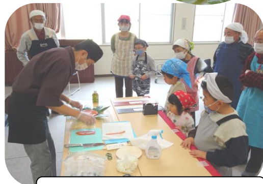
講師の包丁捌きを熱心に見つめる