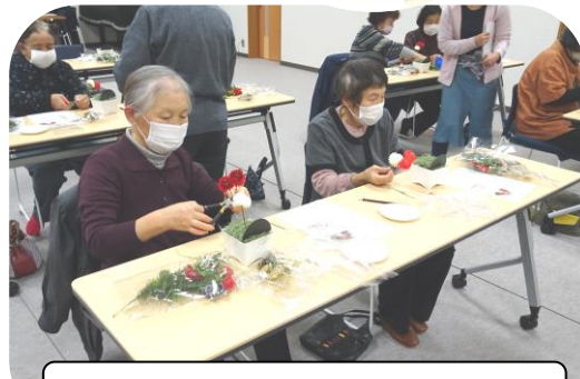
どのように配置すると素敵かしら♪