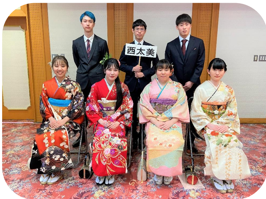
西太美地区成人者の皆さん