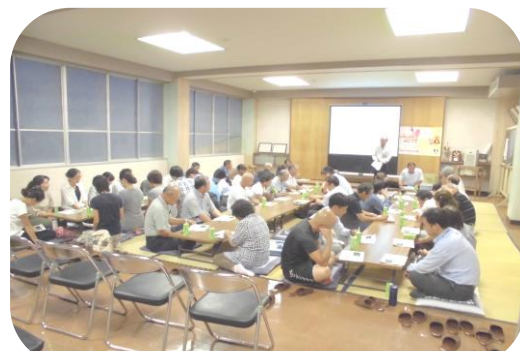
熱心に説明を受ける参加者の皆さん

8月9日（木）JA福光西太美地区センターにて、地域づくり意見交換会が開催されました。南砺で暮らしません課より、今後の少子高齢化、人口減少に対応していくため、小規模多機能自治推進の重要性が説明されました。将来的には自治振興会、公民館、社会福祉協議会を1本化し、地域の課題に応じた部会を設立する形になるというものです。参加者は「いつから行われるのか」「部会はどうやって決めるのか」「今までも振興会、公民館、社会福祉協議会はまとまっていたのではないのか」「名称はどうなるのか」など活発な質疑応答がありました。また他にも「移住者に市はもっと情報を提供すべき」「空き家情報をもっとオープンにできないか」などの意見もでました。自治振興会は今後小規模多機能自治について、いろいろな意見を聞きながら検討していきたいと思えます。