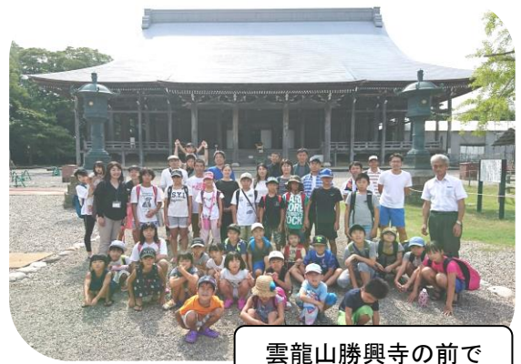
雲龍山勝興寺の前で

8月19日(日)西太美・広瀬館公民館合同の夏休みわくわくツアーを開催しました。氷見市島尾海岸では地引網体験を行い、お昼にバーベキューと取れた魚を一部大漁鍋にいただきました。初めて地引網を体験した子ども達も多く、漁師さんの掛け声で皆一生懸命引っ張り、網にかかった魚に歓声を上げていました。午後からは高岡市伏木の雲龍山勝興寺を見学しました。ガイドさんに境内の七不思議や平成10年から修復中の建物の中を案内してもらい、立派さや珍しさに子どもも大人も感心していました。お友達や家族と体験した1日が夏休みの思い出になってもらえればと思います。