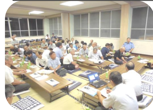
活発な質疑応答が行われる