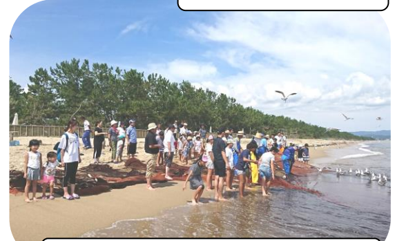
皆で力を合わせて引っ張った地引網