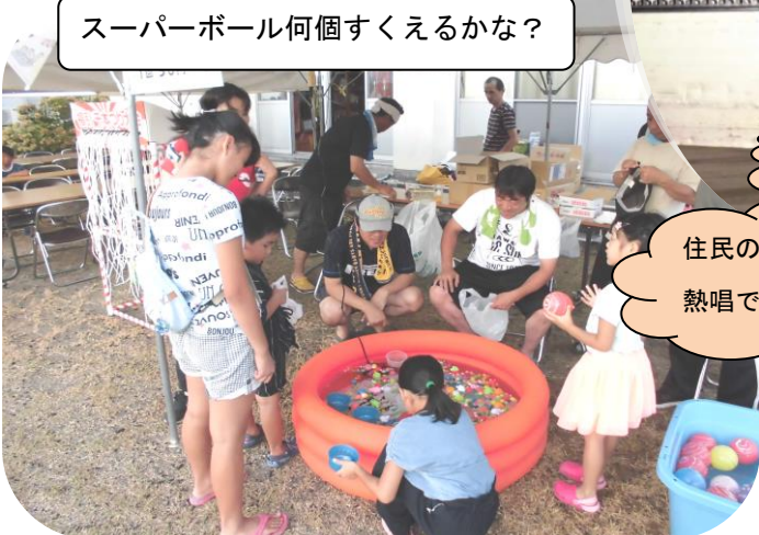
スーパーボール何個すくえるかな？