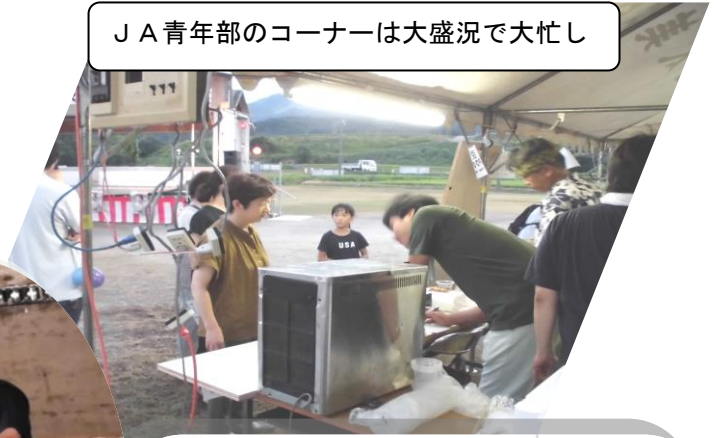
J A 青年部のコーナーは大盛況で大忙し