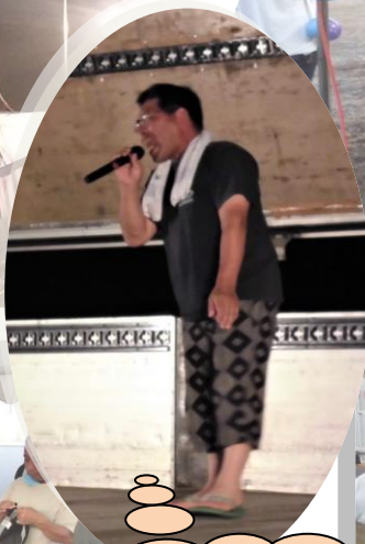
住民の歌謡ショー、 熱唱で聴かせます！