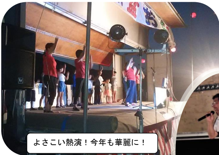
よさこい熱演！今年も華麗に！