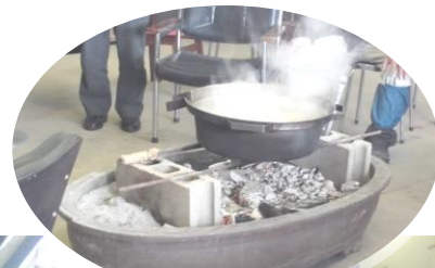
湯気が上がり熱々のぼたん鍋

2月27日（火）福光里山野営場管理棟にて福光里山体育館指定管理者主催、福光里山カウベルト友好会共催で「残雪まつり」が開催されました。南部校区各自治振興会のメンバーやカウベルト友好会の会員などが参加し、平成29年度の事業報告を受けた後、無事1年を終えた感謝と来年度へ向けての安全祈願を込めて懇親会が行われました。会場では熱々のぼたん鍋やカキなどが振舞われ、参加者は山海の幸を味わいながら和やかに談笑していました。