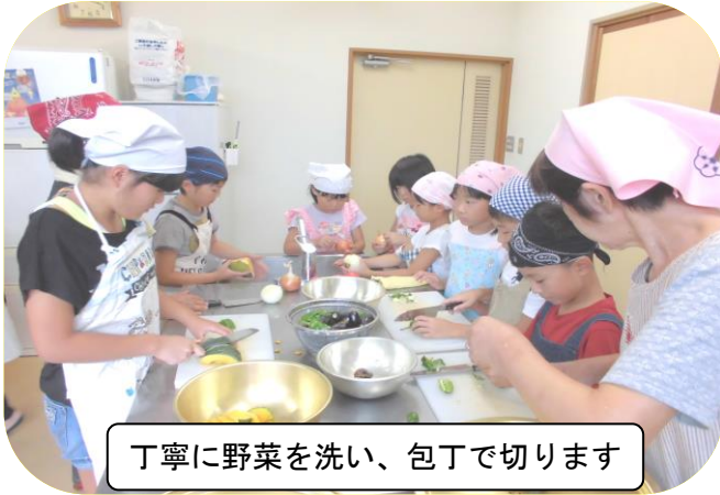
丁寧に野菜を洗い、包丁で切ります