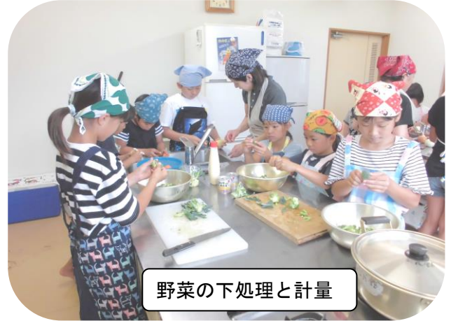
野菜の下処理と計量