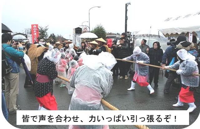
皆で声を合わせ、力いっぱい引っ張るぞ！

11月23日（祝）イオックスアローザスキー場にて「第28回雪恋まつり2018」が開催されました。医王神社にて才川七獅子舞保存会による獅子舞奉納の後、伝統行事「雪曳き」が行われました。西山木遣り保存会による音頭やおおぞら保育園児の「よーいしょ！」という掛け声で杉の大木が動く大勢の観客から声援が上がりました。会場では各地区からの特産物や業者の出店、保育園児などによるステージ発表、ゴンドラ運行などが行われました。あいにくの天候で肌寒い日となりましたが、人出があり賑わっていた様子でした。