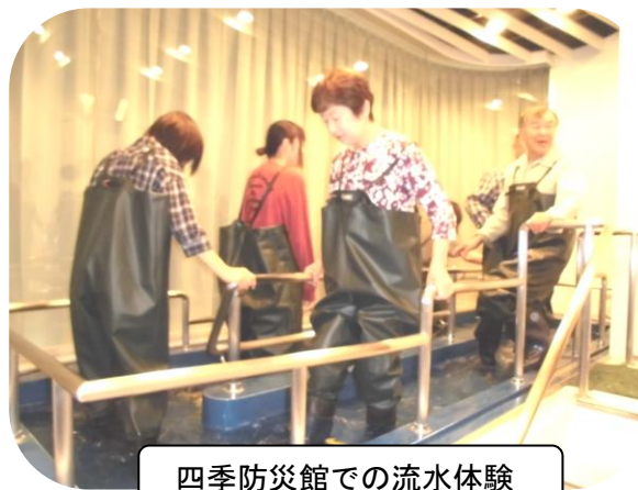
四季防災館での流水体験