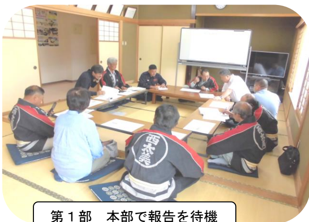
第1部 本部で報告を待機

いざという時にはパニック状態となり、どのように行動すればよいかわからなくなりますが、そういう時こそ日頃の訓練と意識が大切なのではないでしょうか。自主防災会では住民の皆さんの安全を確保するため、また災害時においても迅速に行動をできるようにするため、防災訓練を続けていきたいと思えます。