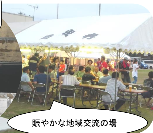
賑やかな地域交流の場