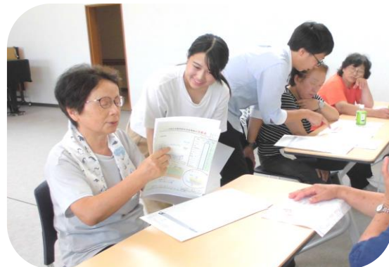
和やかに個人指導