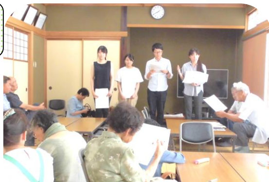
参加者を前に報告する学生の皆さん

地域づくり協議会でもこの調査結果を参考に、今後の地域づくりの検討課題としたいと思います。報告会では個人指導も行われ、皆さんは孫世代の学生と接することで、気持ちがリフレッシュされたようでした。