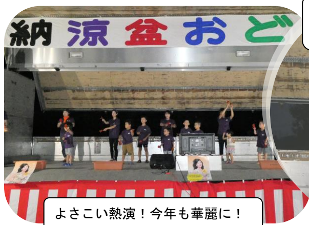
よさこい熱演！今年も華麗に！