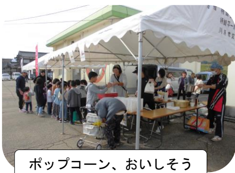
ポップコーン、おいしそう

天気に恵まれ、大勢の方にご来場いただき西太美交流センターまつりを盛会裡に終えることができました。ご協力くださいました皆さんありがとうございました。