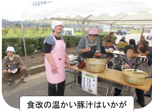
食改の温かい豚汁はいかが