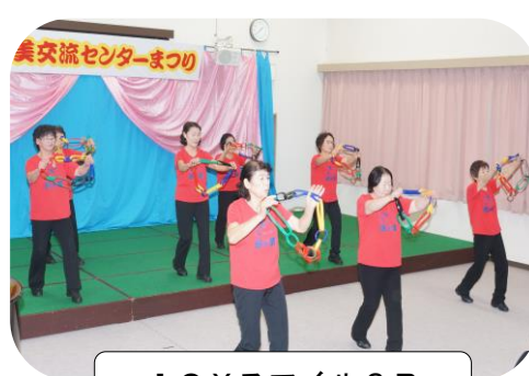
I O Xスマイル3B