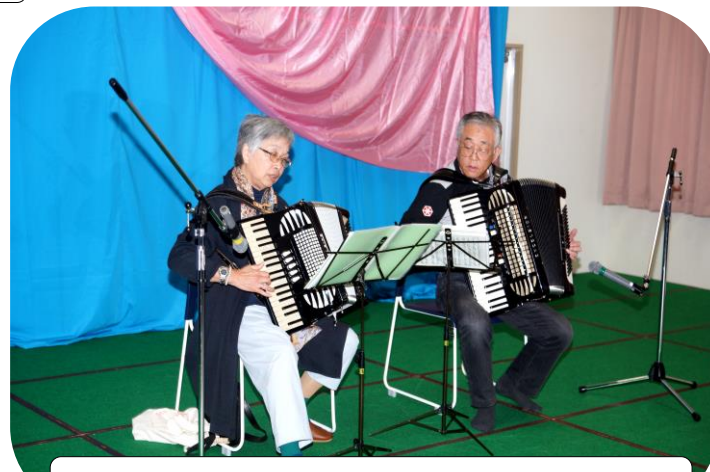
ゲスト出演「とも&しげ」のアコーディオン演奏