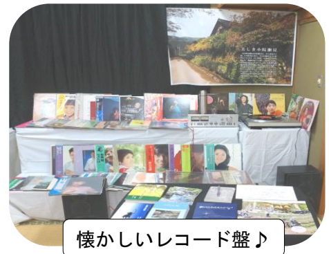
懐かしいレコード盤♪