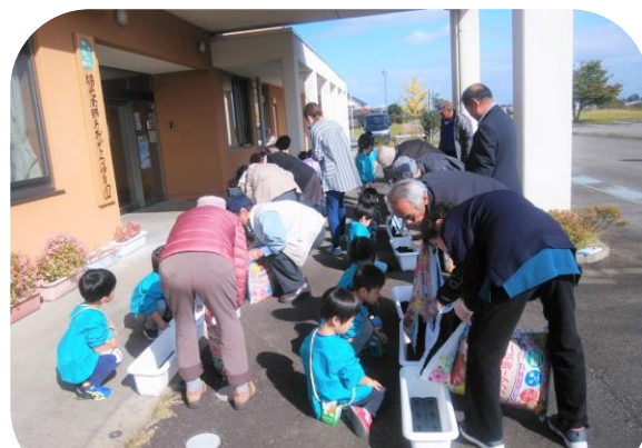
来年チューリップの花が咲きますように

11月8日（金）第5回そくさい会が開催されました。午前中は福光南部あおぞら保育園にて交流会が行われ、園児と一緒にチューリップの球根を植えるなどしました。西太美交流センターで昼食をとり、午後はヘルスポランティアによる軽体操やおしゃべりなどでゆっくり過ごしていただきました。参加者からはこきりこ節演奏の披露も行われ和やかな雰囲気でした。