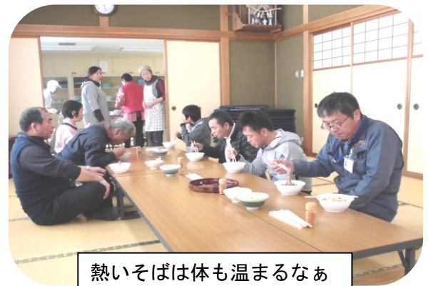
熱いそばは体も温まるなあ