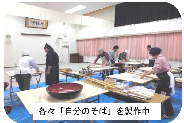
各々「自分のそば」を製作中