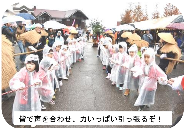
皆で声を合わせ、力いっぱい引っ張るぞ！

11月23日(祝)イオックスアローザスキー場にて「第27回雪恋まつり2017」が開催されました。医王神社にて才川七獅子舞保存会による獅子舞奉納の後、伝統行事「雪曳き」が行われました。西山木遣り保存会のメンバーによる音頭やおおぞら保育園児の「よーいしょ！」という掛け声で長さ7メートルの杉の大木が動くとき大勢の観客から声援が上がりました。会場では各地区からの特産物や業者の出店、保育園児などによるステージ発表、ゴンドラ運行などが行われました。あいにくの天候で肌