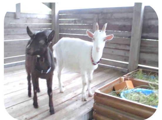
仔ヤギのクロちゃんとシロちゃん

さて、6月のはじめに仔ヤギが2頭やってきました。「クロちゃん」と「シロちゃん」です。除草と獣除けに役立つのか実験してみようということで、秋まで借りる予定です。天気のいい日は畑につないだり散歩していることもあります。とっても可愛いのでぜひ会いに来てくださいね。ツリーハウスのあるカーサ小院瀬見駐車場の隅にヤギ小屋があります。