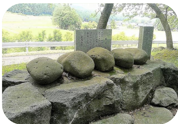
広谷八幡社境内の盤持石

古くは江戸時代以前から全国的に、重い石（盤持石）を持ち上げ体力づくりや力試しを行う習慣があった。広谷地区にもその頃のものと思われる盤持石が数か所にわたって置かれていた。平成4年10月、広谷の世話役ら有志がそれらを広谷八幡社の境内に集め、台座を作り並べ祀られた。今見ても盤持石は一抱えもある大きさで、それを持ち上げている当時の若い衆の精気があふれるような力強さ、逞しさが蘇ってくる。