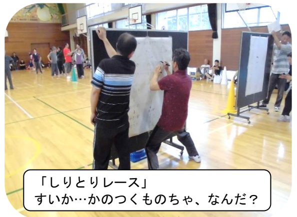
「しりとりレース」 すいか…かのつくものちゃ、なんだ?