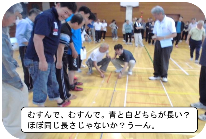
むすんで、むすんで。青と白どちらが長い? ほぼ同じ長さじゃないか? うーん。