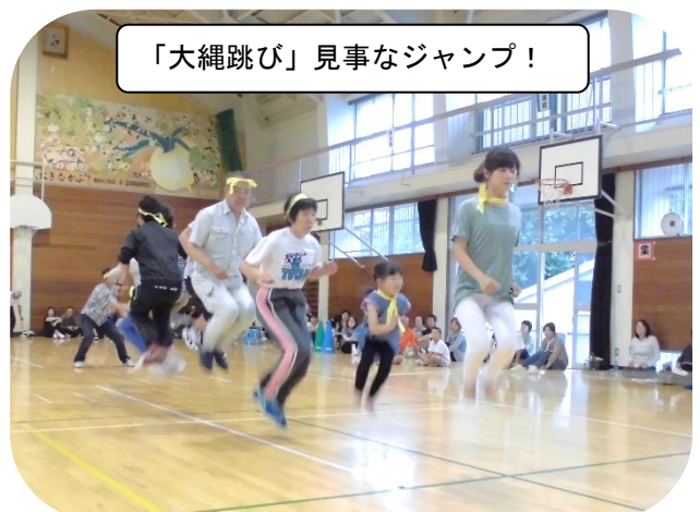
「大縄跳び」見事なジャンプ!