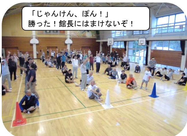
「じゃんけん、ぽん!」 勝った! 館長にはまけないぞ!