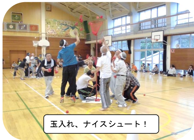
玉入れ、ナイスシュート!