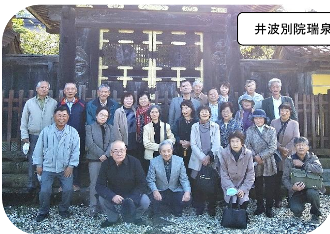
井波別院瑞泉寺にて