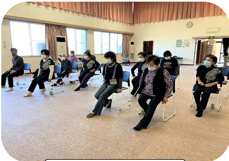
つま先をピンとのばしましょう！

福祉の里西太美は、第2期貯筋運動教室を開催しました。健康寿命をのばすため、認知症予防と筋力アップを図ることを目的としたもので、福光スポーツクラブの嶋田講師のもと10・11月の毎週木曜日に行います。これから冬にかけて、寒さと運動不足で体や関節が硬く縮こまりがちになりますが、貯筋運動で血行を良くし、スクエアステップなどでみんなでかけ声を合わせ楽しく行っていきたいと思います。