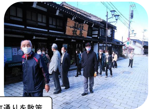
八日町通りを散策