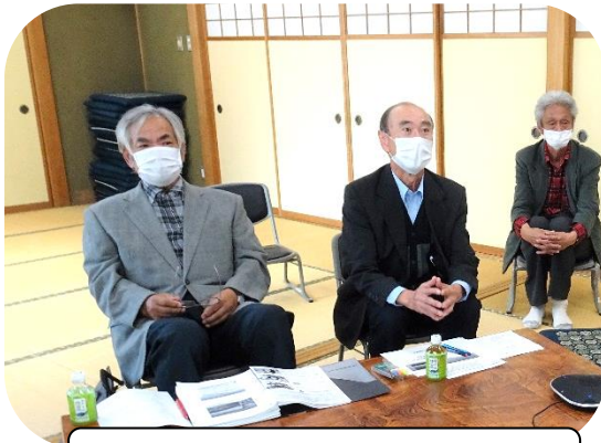
説明を行う柴会長と吉野副会長