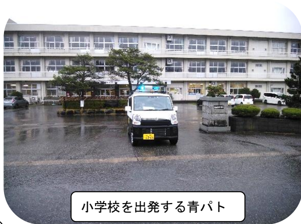
小学校を出発する青パト

11月22日（月）西太美地区防犯組合は、防犯パトロールを行いました。今年度から、クマの出没や不審者から子どもたちを守るため、南部小学校の下校時間に合わせて、西太美地域内を青パトで巡回しています。