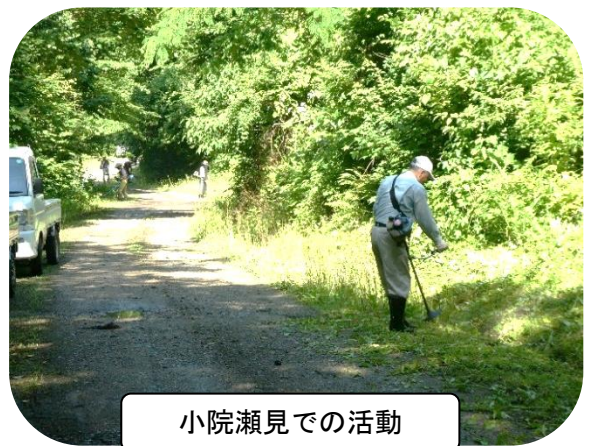
小院瀬見での活動