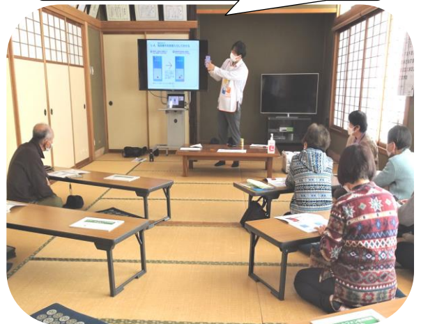
スマホの基本からおさらいしました

12月8日（木）第2回スマホ教室を開催しました。となみ衛星通信テレビ(株)から講師に来ていただき、「スマホの基本講座」と「マイナカードの申請について」を教わりました。教室ではスライドやテキストを使ってわかりやすく説明され、参加者は講師と一緒にスマホを操作しながら学んでいました。1月は「パスワードの管理の仕方」について学びます。詳しくはチラシをご覧ください。