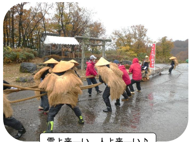
雪よ来—い、人よ来—い♪

11月23日（水）イオックスアローザで雪恋まつりが行われました。スキーシーズンを前に、医王神社で安全祈願祭が行われ、関係者らがスキー客の安全と降雪を願いました。続いて西山木遣り保存会の方々による雪曳きが行われました。あいにくの雨でしたが、木遣り唄に合わせた威勢のいい掛け声が響きわたり大木が引かれていきました。なお、コロナ感染症対策としてステージ発表や出店は行われませんでした。