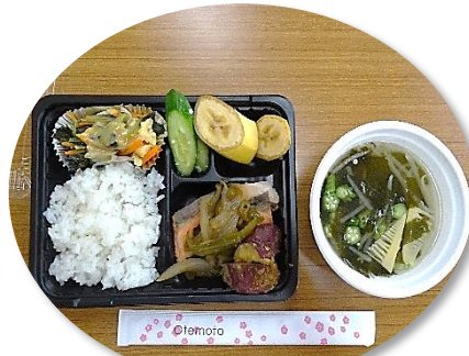
栄養バランスのとれた 食改さんによるお弁当