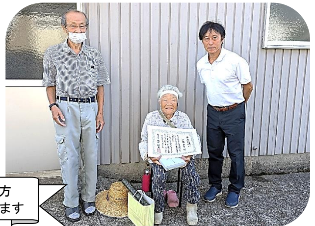
米寿をお迎えの方 おめでとうございます