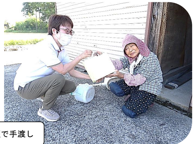
社会福祉推進委員が笑顔で手渡し