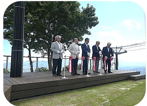
オープニングセレモニーでのテープカット

9月9日(土)イオックスアローザのゴンドラ山頂駅に「山のテラス」が完成し、オープニングセレモニーが行われました。「山のテラス」からは砺波平野が一望でき、また日陰を作る棚やドッグランなど、グリーンシーズンの新しい魅力を楽しめるそうです。10月9日まで第13回キバナコスモス祭りが開催されています。この機会に足を運んでみられたらいかがでしょうか