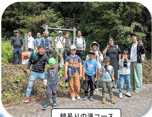
緋吊りの滝コース