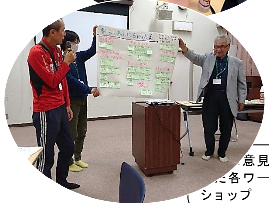
意見が 各ワーク ショップ