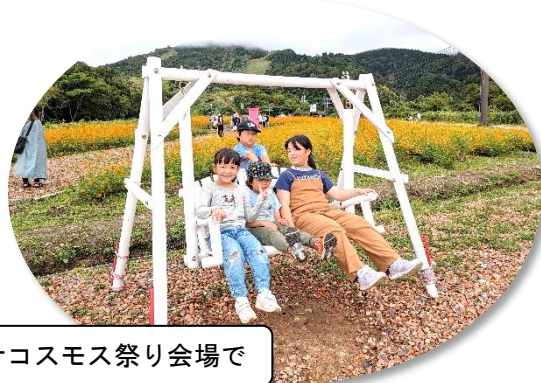
キバナコスモス祭り会場