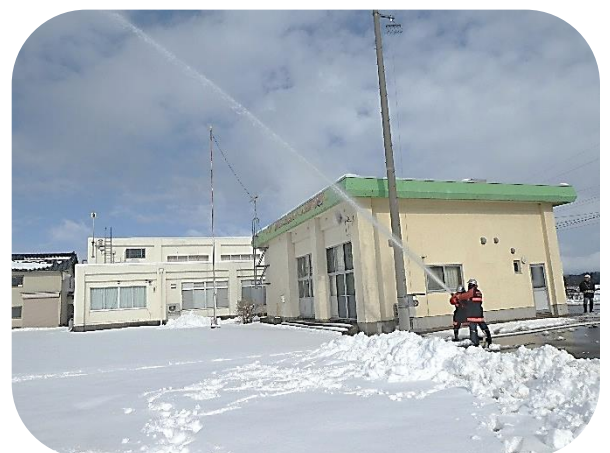
消防団員による迫力ある放水