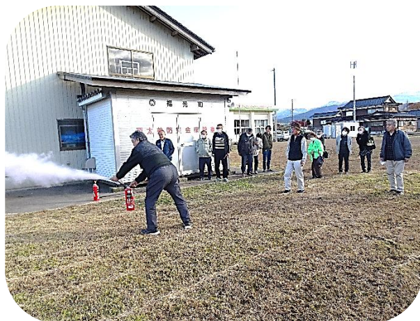
消火器を使ってみました

万が一に備え、毎年避難訓練の実施を予定しています。交流センターを利用される皆さまにはご理解とご協力の程よろしくお願いします。