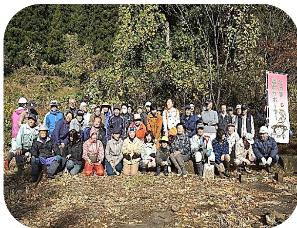
今回活動していただいた皆さん

当日は、グリーンツーリズム等の他の団体の参加者もあり大勢で取り組んだことにより2時間余りで終了して、小院瀬見の皆さんから感謝されました。