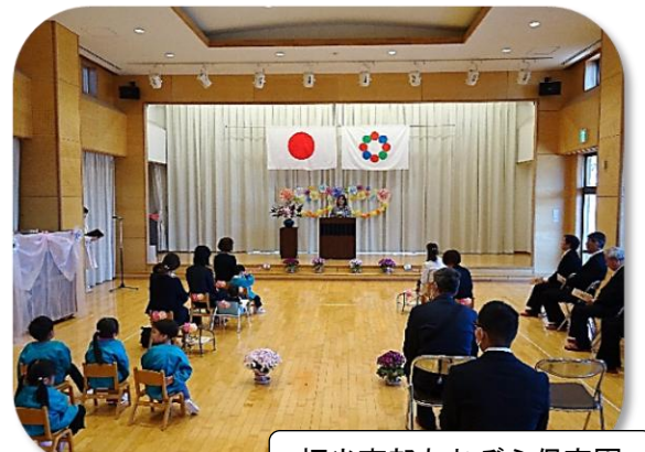
福光南部あおぞら保育園

福光南部あおぞら保育園 入園児 5名 (西太美地区は0名) 福光南部小学校 新入生 11名 (西太美地区は1名) 福光中学校 新入生 74名 (西太美地区は7名)