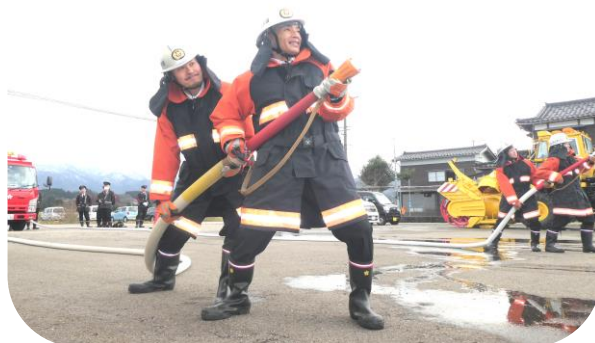
住民や団員らが見守る中、威勢よく放水！