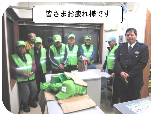
皆さまお疲れ様です

盗難事件や不審者情報が多発する昨今ですが、住民の皆さんが安全にまた安心して暮らすことができるように活動が続けていきたいと思います。