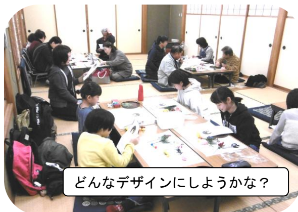
どんなデザインにしようかな？