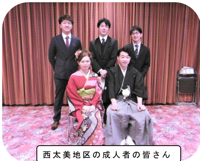
西太美地区の成人者の皆さん